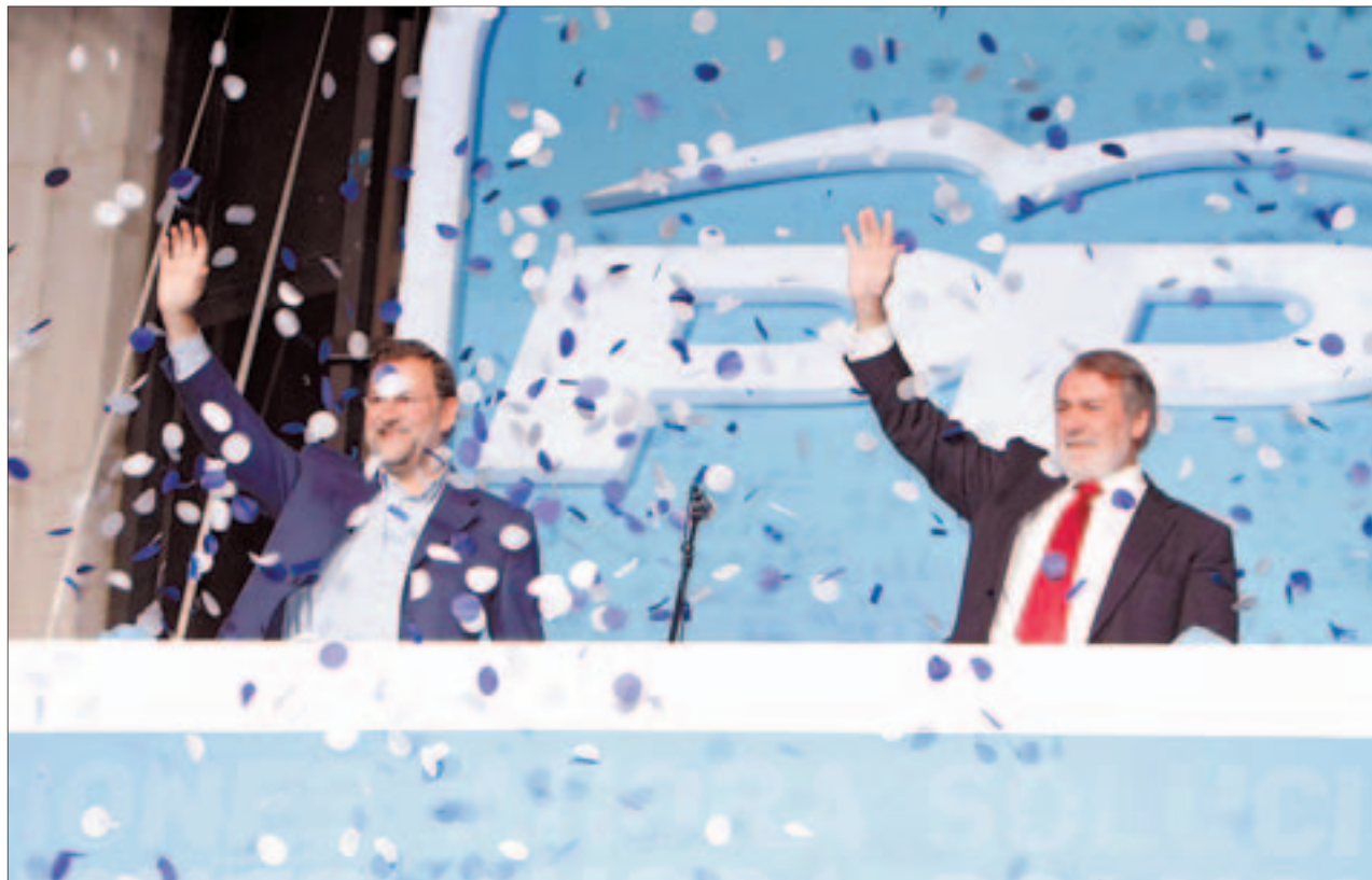
Mariano Rajoy y Jaime Mayor Oreja saludan a los simpatizantes del PP desde la sede del partido en la calle Génova, en Madrid.