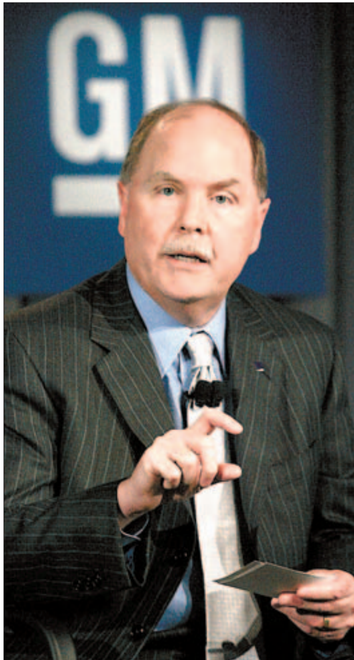
El presidente de GM, Fritz Henderson, ayer en Detroit.

ron ayer el temor a que la extensión de la enfermedad por el resto del mundo agrave la recesión mundial, aunque la caída de las Bolsas fue moderada. La industria turística española dice que no ha sufrido aún cancelaciones masivas, pero las agencias temen que se produzcan en los próximos días. PÁGINAS 20 Y 35