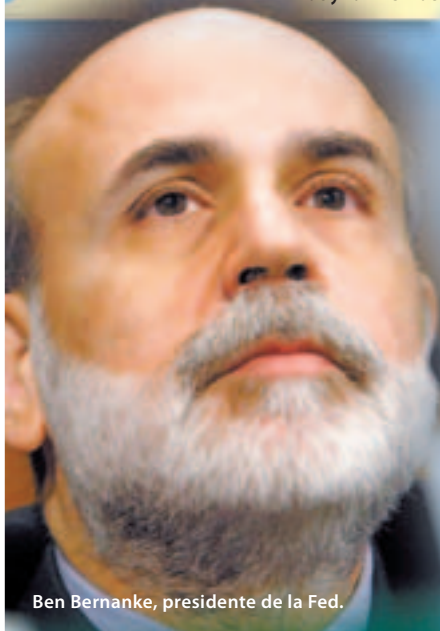
Ben Bernanke, presidente de la Fed.

Mantiene los tipos de referencia entre el 0% y el 0,25%